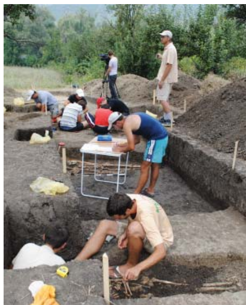
Fig. 1. Echipa de cercetare pe șantierul arheologic.