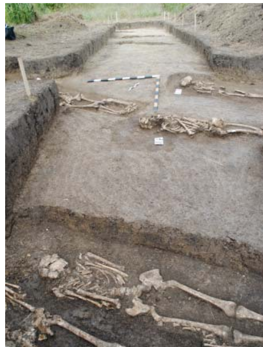
Fig. 4. Lozova. Secțiunea III, vedere dinspre sud-est