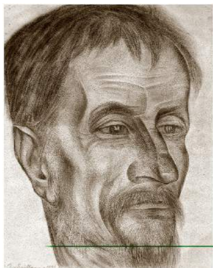
Auguste Baillayre. Portret de bărbat , 1921.

acumulează tot spectrul de interese profesionale ale pictorului: peisaje olandeze, nocturne din Petersburg, scenografii și ilustrații, picturi simbolice și constructiviste, portrete, afișe etc.