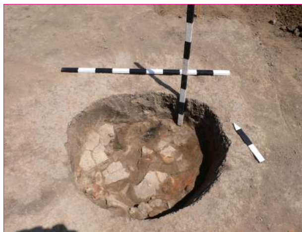
Figura 4. Cărbuna II. Groapa 1.

și polonice cu mânere antropomorfizate etc. Pe o serie de vase din această categorie (străchini, castroane, vase piriforme) este atestată pictura roșie crudă. Un fragment de vas decorat cu caneluri și incizii verticale, provenit din perieghetză, are suprafața acoperită cu angobă albicioasă pe care au fost trasate cu roșu crud două benzi late (figura 5/6). Suprafața interioară a fragmentului de asemenea poartă urme de pictură roșie crudă. Un capac, găsit în primul complex, are exteriorul buzei S-oidale acoperit de jur împrejur cu pictură roșie crudă. În gropi și stratul de cultură au fost găsite numeroase fragmente de recipiente(?) modelate