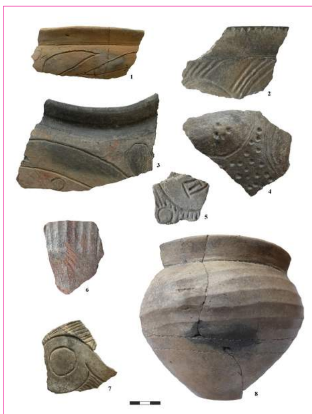
Figura 5. Cărbuna II. Fragmente ceramice din groapa 1 (1-4, 7, 8) și de la suprafața așezării (5, 6).

din lut cu adaos de pleavă. Ele au suprafețele bine netezite și acoperite, în unele cazuri, cu angobă alb-gălbuie. Majoritatea reprezentărilor plastice antropomorfe descoperite provin din stratul de cultură. Ele sunt reprezentate de statuete cu sau fără decor incizat de diferite dimensiuni. Unele exemplare au mâinile redat în relief. Din pastă fină sunt modelate și două conuri mici, fragmentul unui tron miniatural și al unei măsuțe. Industria litică de la Cărbuna II este reprezentată de piese de silex (lame, gratoare, nuclee, așchii etc.) și gresie (rășnițe, frecătoare). Remarcăm prezența unui microlit geometric și a unui vârf de silex prelucrat cu