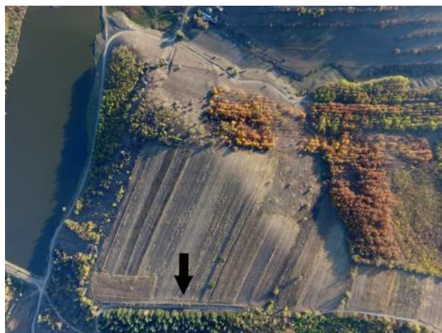
Figura 3. Cărbuna II. Vedere aeriană.

și polonice cu mânere antropomorfizate etc. Pe o serie de vase din această categorie (străchini, castroane, vase piriforme) este atestată pictura roșie crudă. Un fragment de vas decorat cu caneluri și incizii verticale, provenit din perieghetză, are suprafața acoperită cu angobă albicioasă pe care au fost trasate cu roșu crud două benzi late (figura 5/6). Suprafața interioară a fragmentului de asemenea poartă urme de pictură roșie crudă. Un capac, găsit în primul complex, are exteriorul buzei S-oidale acoperit de jur împrejur cu pictură roșie crudă. În gropi și stratul de cultură au fost găsite numeroase fragmente de recipiente(?) modelate