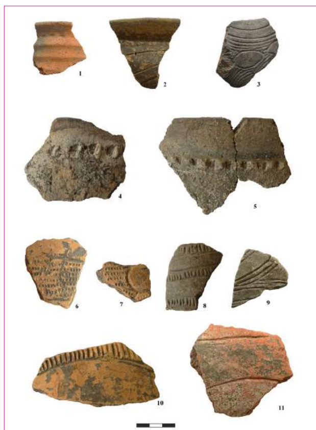
Figura 2. Cărbuna I. Ceramică din sondajul 1.

începând cu adâncimea de 1,20-1,25 m de la suprafața actuală a solului. El consta din fragmente de lut ars, fragmente ceramice, oase de animale, piese de silex și gresie. Din sondaj provin și două reprezentări plastice antropomorfe. La un exemplar picioarele și pliurile inghinale sunt delimitate prin linii incizate. Ceramica recuperată este în mare parte acoperită cu un strat de săruri insolubile (figura 2/1-11). De asemenea s-au