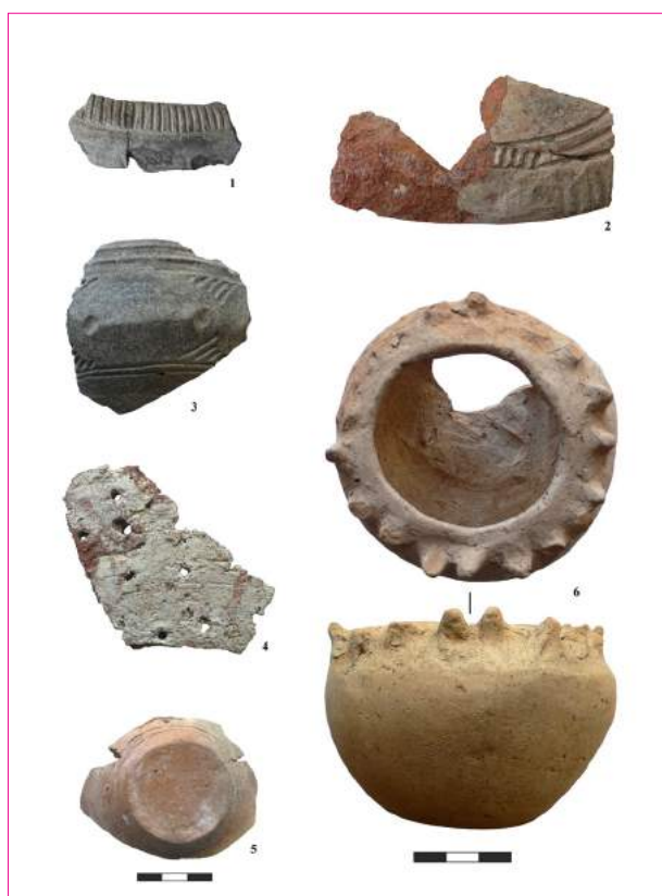
Figura 6. Cărbuna. Ceramică din situl descoperit în anul 2018.