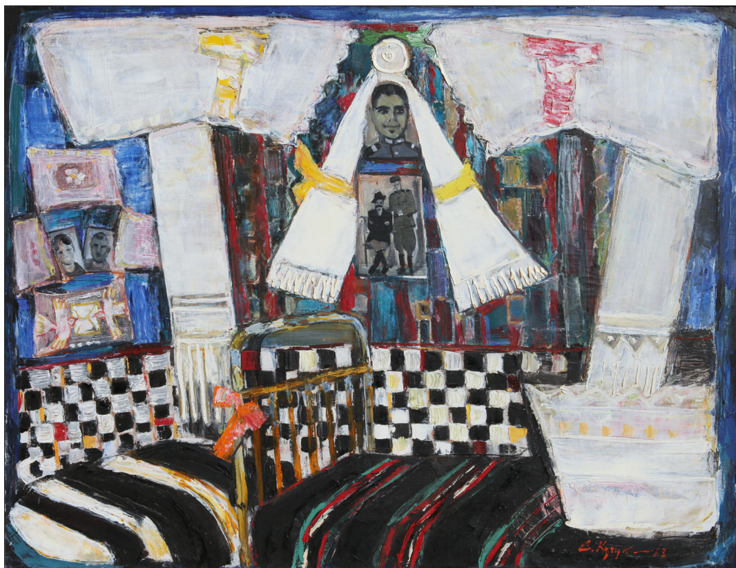
Sergiu Cuciuc. Casa mare, u. p. , 1968, 110 × 130 cm.

18. Gosudarstvennyj reestr pamjatnikov respublikanskogo i mestnogo znachenija pmr. [on-line] http://culture.gospmr.org/istoricheskoe-nasledie/86-nedvizhimye-ob-ekty-kulturnogo-naslediya-pmr/637-gosudarstvennyj-reestr-pamyatnikov-respublikanskogo-i-mestnogo-znachenija-pmr (vizitat la 22 mai 2020).