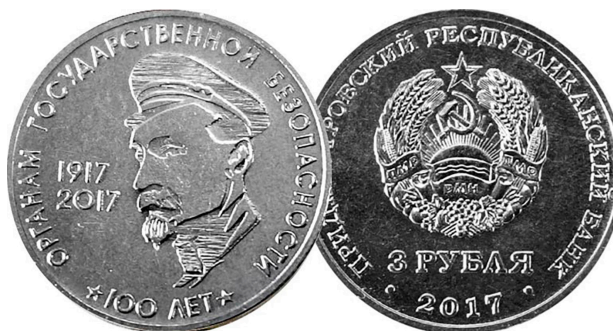
Foto 8. Monedă jubiliară „100 de ani ai organelor securității de stat ale republicii moldovenești nistrene, 1917–2017”, cu efigia lui Felix Dzerzhinskij, președintele VChK, unul dintre protagoniștii terorii roșii .

În contextul dat, ideologia separatismului vehiculează imagini mitice despre trecut, dar și proiecții utopice despre viitor, adesea în acord cu o mentalitate totalitară recurentă, pasibilă să transforme regiunile separatiste în „găuri negre” dominate de economia tenebră și regimuri autoritar-mafiotice. O astfel de memorie este utilă doar pentru legitimarea ordinii represive a unui regim post-totalitar, care nu și-a găsit rostul în procesele occidentalizării și modernizării.