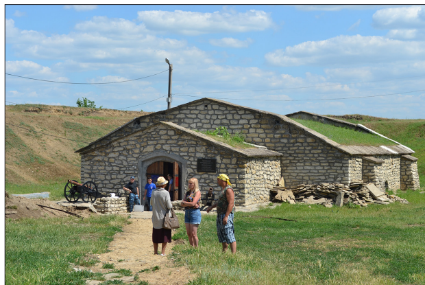
Foto 5. Locul execuțiilor în masă. Spațiul bastionului Sf. Vladimir și Beciul de pulbere al fortăreței din or. Tiraspol, 2016.

și în special să abordeze aspectul responsabilităților celor implicați în crimele regimului comunist. Formula discursivă „să nu se speculeze”, uzată de liderii entității separatiste, reprezintă o strategie generalizată a „amneziei fericite” menite să saboteze discuțiile publice și evocările naturii criminale a regimului totalitar-comunist care, după cum se crede, ar putea eroda temelia ideologică pe care s-a clădit enclava separatistă de pe malul stâng al râului Nistru. Colecția de volume sub titlul История Приднестровской Молдавской Республики (Istoria republicii moldovenești nistrene), publicată în 2011 la Tiraspol în calitate de sinteză a istoriei regiunii separatiste [7], în compartimentul care ar trebui să elucideze perioada marii terori , de facto, reciclează pattern-uri ideologice de tristă pomină. Pe fundalul evocat al „marilor realizări” în RASSM în domeniile industrializării sovietice, dezvoltării gospodăriilor țărănești și colectivizării, culturii și științei sovietice obținute sub „înțeleapta îndrumare” a PC(b) al URSS, atât marea teroare , cât și alte atrocități ale regimului stalinist sunt tratate drept episoade regretabile, însă minore și improprii cursului general ales spre viitorul „fericit și luminos” al comunismului.