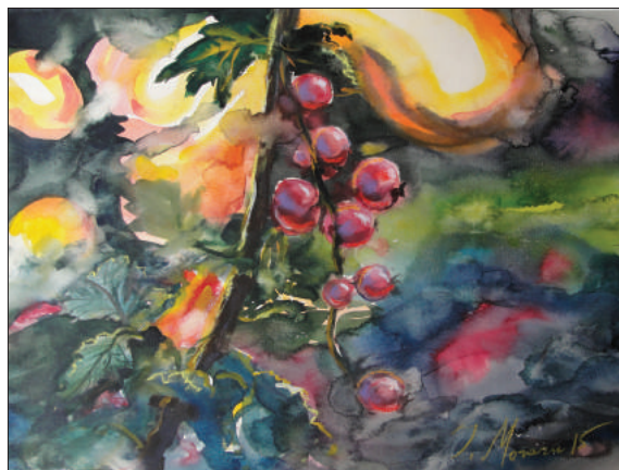
Ion Moraru. Culorile verii , acuarelă, 40 × 50 cm, 2015.

Fiind familiarizat cu mai multe ambianțe artistice, dar mai ales cu cele „moldo-americane”, artistul a declarat în repetate rânduri că aceste două spații culturale – SUA și Republica Moldova – sunt deosebit de benefice creației sale. A revenit de fiecare dată acasă pentru a-și potoli setea de tradițiile strămoșești, dorul de meleagul natal și de vechii prieteni. Pe continentul american, a surprins splendorile naturii, imaginea oamenilor și a urbelor moderne din aceeași perspectivă a deschiderii sufletești adusă de acasă. „Merg pe starea sufletului meu” este afirmația ce-l caracterizează deplin. În consecință, se bucură că expozițiile și evenimentele pe care le-a organizat contribuie la promovarea imaginii Republicii Moldova. În ideea că oamenii de artă și sportivii sunt cei mai buni ambasadori ai țării de origine, consideră că prin cele peste 20 de expoziții desfășurate în SUA americanii au avut pri-