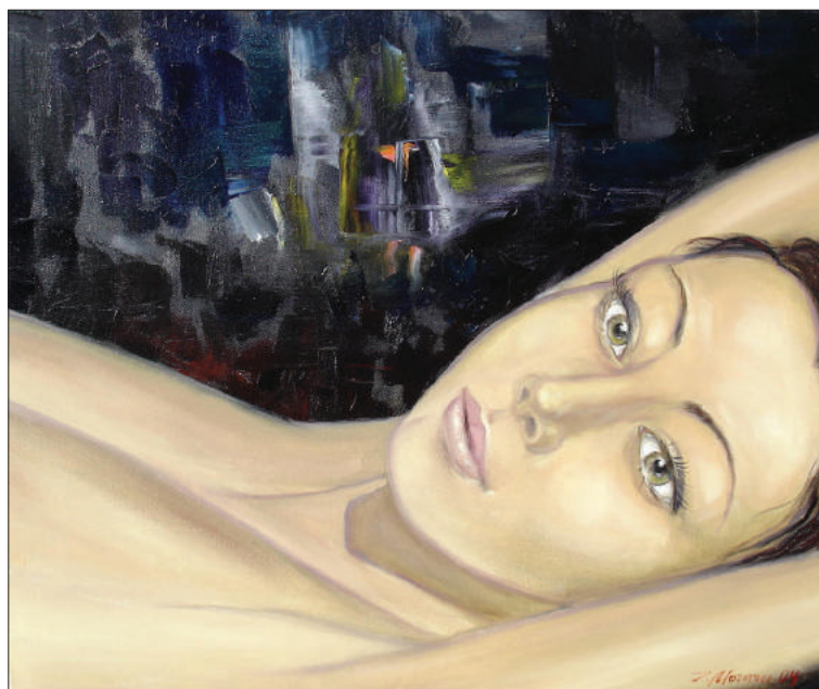
Ion Moraru. Muza , ulei, pânză, 40 × 55 cm, 2005.

Un profesionist prolific și polyvalent, a acordat dintotdeauna prioritate acuarelei ce domină anturajul expozițiilor sale personale. O tehnică și un gen complicat și complex inclusiv prin imposibilitatea de a modifica straturile de culoare așternute deja pe hârtie, spontaneitatea fixării culorilor, imprezvizibila/ previzibila lina lor explozie, acestea devenind mai opace după uscare sau după numeroasele variante ce pot fi aplicate