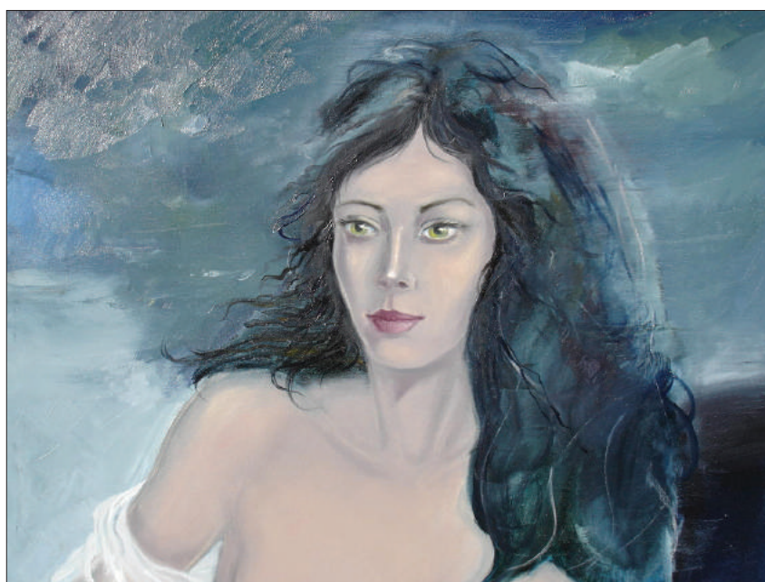
Ion Moraru. Portret de fată , ulei, pânză, 50 × 60 cm, 2005.

Cu prilejul vernisajului din 2015 la Piatra Neamț, Lucian Strochi avea să-l caracterizeze pe Ion Moraru, drept un artist care posedă taina „inițierii” în sensul cel mai profund al acestui cuvânt. „Artistul se supune naturii, convențiile sunt în general respectate, deși,