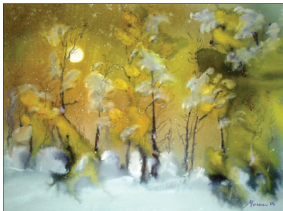
Ion Moraru. Iarnă în galben , tehnică mixtă, 40 × 50 cm, 2006.