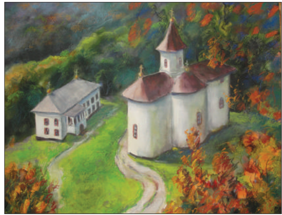
Ion Moraru. Mănăstirea Rudi , tehnica mixta, 50 × 60 cm, 2011.

în fiecare tablou, un nor, o rază, o ploaie, o iluminare, modifică această relație directă, filtrând-o, potențând-o, scoțând-o din clișee previzibile. El evocă toate cele patru anotimpuri, noaptea și ziua, dimineața și seara, personajele (puține), casele, turlele sunt anistorice, adică eterne. Iluzia localizării e perfectă: se pot recunoaște anume spații moldave, de pe Valea Bistriței sau a Tarcăului, obcini și păduri bucovinene, melea-guri basarabene. În realitate, pictorul lucrează cu câteva elemente doar, dar esențiale și eterne: casa, copacul, cerul, apa, dealul, luna, biserica. Sunt (poate) șapte la număr, fiecare element având rolul unei note muzicale, iar „șapte” nu trebuie uitat, e cifra inițierii. Suntem invitați, așadar, la o inițiere, la o intrare în decor ... pictorul „oficiind” în tăcere, calm și expresiv”.