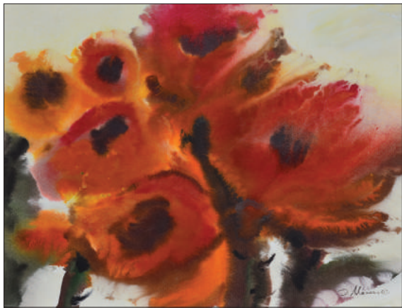
Ion Moraru. Freamatul florilor , acuarelă, 34 × 45 cm, 2003.