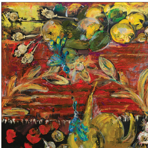
Motiv țărănesc , triptic, 2012, u. p., 70 × 70 cm.