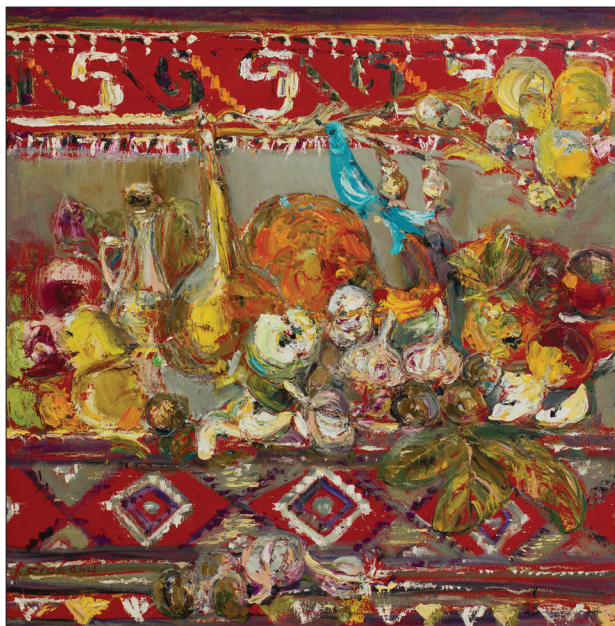
Motiv țărănesc, triptic , 2012, u. p., 70 × 70 cm.

În lucrările Iraidei Ciobanu spațiul aerian este redus, obiectele sau componentele pitorești ale priveliștilor se intercalează, autoarea apropiindu-le vizual de spectator. Acest procedeu este utilizat de Iraida Ciobanu începând cu anii 2000, de atunci încolo el devenind o trăsătură specifică a creației sale. Interferența naturii statice cu peisajul într-o singură pânză o identi-