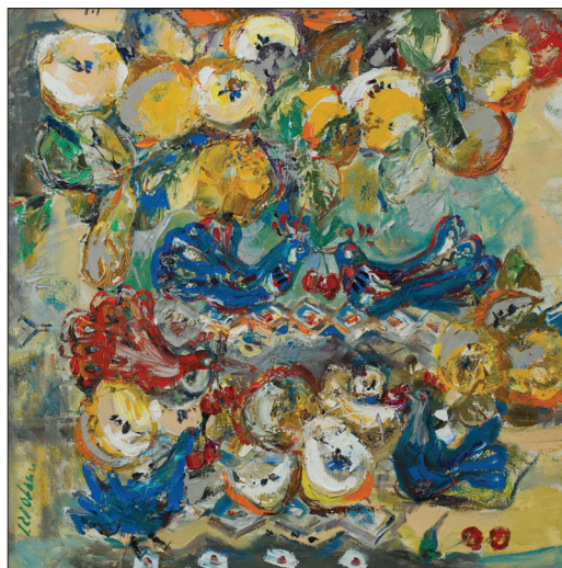
Fructe și păsări , 2013, u. p., 80 × 80 cm.

fică în mod special, mai puțin în Natura statică cu cireșe (2007), Mușcate (2008) sau Toamnă (2008) tripticul Arhaisme autumnale (2009), Iarnă (2011) și Crengi cu gutui (2012), mai accentuat în lucrările Stare I, Stare II, Motiv rustic (2009), Lacul codrilor albaștri (2010), Lumea melcilor (2011) [3], în care este imposibil de identificat limitele naturii statice și începuturile peisajului. În funcție de starea emotivă a autoarei culorile tablourilor sunt decorative și sonore sau pastelate și calde.