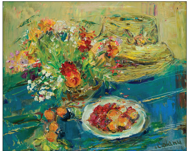
Natură statică cu pălărie , 2013, u.p., 50 × 60 cm.

Autoarea reușește să arate că rigiditatea compozițională a naturilor statice poate fi lejer depășită prin expresivitate și unicitate. Prin lucrările sale, natura statică, considerată un gen minor, este reinterpretată și revine în actualitate, afirmându-și emoția și farmecul special. Și peisajul, și natura statică, prezentate la vernisajele personale, sunt ca o ofrandă adusă naturii. Teza sa de doctor în studiul artelor și în culturologie, consacrată evoluției naturii statice ca gen în spațiul basarabean din perioada postbelică reprezintă o analiză consistentă și pertinentă a unui domeniu puțin explorat de criticii de artă. Este și un valoros material didactic, care poate fi folosit în procesul de educație artistică în instituțiile de învățământ preuniversitar și universitar.