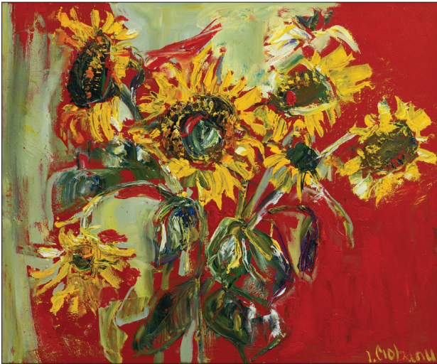
Floarea-soarelui , 2012, u. p., 60 × 70 cm.