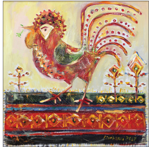
Cocoșul năzdrăvan , 2017, u. p., 80 × 80 cm.

terpretează într-o manieră proprie. Ceramica și covoarele tradiționale, broderiile moldovenești sunt transferate pe pânză în forme stilizate, astfel încât se recunosc lejer în calitatea lor de simbol. Coloritul policrom și diversitatea motivelor compoziționale se perindă firesc în lucrările sale. Un element indispensabil în creația Iraidei Ciobanu este pasărea, care figurează în majoritatea lucrărilor: hulubi, pupeze, cocoși, cu particularitățile distincte ale faunei, peregrinând printre maci, iriși, crini și trandafiri ( Motiv festiv, Păsări și fructe (2014), Flori și păsări, Păsări și flori (2014)). Un simbol care o reprezintă este pomul vieții ( Motiv simplu, Nu mă uita (2017), Motiv popular (2016, 2017), Floare albastră, Dedicție (2017)) etc. [2], cicluri pictate cu o pensulație accentuată în nuanțe pastelate. Lucrarea Dedicție , pentru