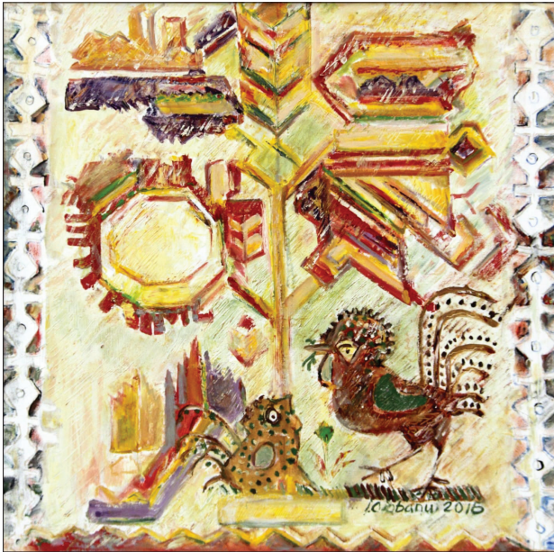
Motiv țărănesc , 2016, u. p., 80 × 80 cm.

Autoarea reușește să arate că rigiditatea compozițională a naturilor statice poate fi lejer depășită prin expresivitate și unicitate. Prin lucrările sale, natura statică, considerată un gen minor, este reinterpretată și revine în actualitate, afirmându-și emoția și farmecul special. Și peisajul, și natura statică, prezentate la vernisajele personale, sunt ca o ofrandă adusă naturii. Teza sa de doctor în studiul artelor și în culturologie, consacrată evoluției naturii statice ca gen în spațiul basarabean din perioada postbelică reprezintă o analiză consistentă și pertinentă a unui domeniu puțin explorat de criticii de artă. Este și un valoros material didactic, care poate fi folosit în procesul de educație artistică în instituțiile de învățământ preuniversitar și universitar.