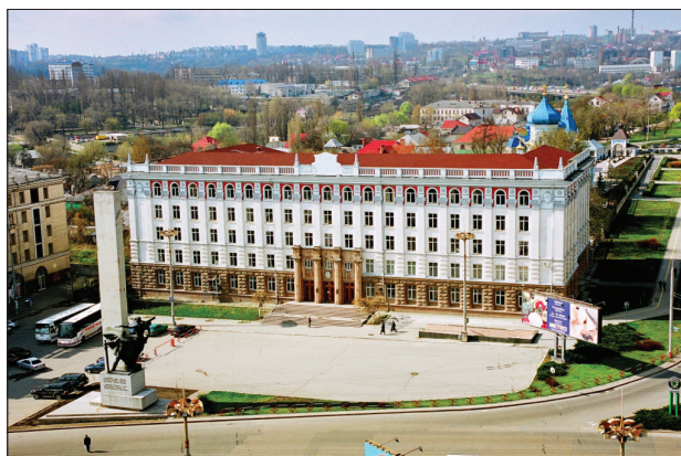
Figura 4. Sediul AȘM, anul 2006.

„Partea inferioară a frontonului conține o placă cu o linie în formă de zigzag sub care, pe centru, se află un feston (ghirlandă de sărbătoare). Fațada principală, din proiectul elaborat în martie 1952, era încununată de mici frontoane laterale. De ambele părți laterale se află câte un obelisc similar frontonului central. Iar sub această compoziție se află o placă dreptunghiulară cu ornament de linie zigzagată. Conform proiectului din anul 1954, pe părțile laterale, de colț ale clădirii se află scuturile cu cartușe, lateral decorate cu două vrejuri suspendate, iar centrat este anul 1955. Aspectul monumental este reprezentat prin îmbinarea pilaștrilor și coloanelor atât pe fațada principală, cât și pe cele laterale. Capitellul pilastrului este decorat cu un ornament floral, flancat de două volute, dedesubt se află două festoane cu ciucuri, care conțin struguri de viță-de-