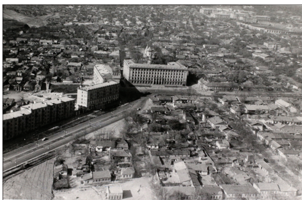
Figura 1. AȘM la etapa construcției, începutul anilor 1950.