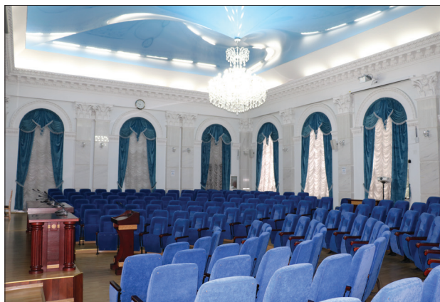
Figura 7. Sala Azurie a AȘM, 2022.

Academiei de Științe, în cadrul celei de-a XV-a ediții a lecturilor academice dedicate Sărbătorii Naționale „Limba Noastră cea Română”, la 30 august 2019, acad. Ion Tighineanu, președintele AȘM, și acad. Emil Burzo, pe atunci președinte al Filialei Cluj a Academiei Române, au tăiat panglica inaugurală a Sălii de Lectură a AȘM, care în anii următori, în baza donațiilor, și-a extins substanțial fondul de carte existent [31, pp. 9-21]. De asemenea, la etajul unu al sediului AȘM se află Muzeul Științei, care după reparația capitală se află actualmente la etapa refacerii expozițiilor științifice. De-a lungul anilor, sediul central al AȘM a găzduit mai multe institute socio-umaniste, Redacția Principală a Enciclopediei Sovietice Moldovenești ș.a.