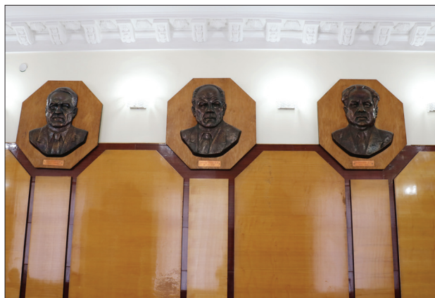
Figura 8. Sala Mică a AȘM cu basoreliefurile înaintașilor.

În perioada președinției acad. Aleksandr Jucenko, 1977–1989, Sala Mică a fost îmbrăcată în panouri de lemn și înzestrată cu basoreliefuri din bronz ale fondatorilor AȘM, membri titulari și membri corespondenți numiți la 2 august 1961, care au format corpul inițial al savanților Academiei de Științe a RSSM (figura 8). Prin Hotărârea Sovietului de Miniștri al RSSM din 1 august 1961, au fost desemnați 24 de membri ai Academiei: 11 membri titulari – chimistul Anton Ablov, matematicianul Vladimir Andrunachievici, economistul Vasili Cervinski, agronomul Prokofi Dvornikov, istoricul Iachim Grosul, inginerul Boris Lazarenko, chimistul Gheorghi Lazurievski, poetul Andrei Lupan, biologii Iacob Prinț și Aleksei Spassky, lingvistul și istoricul literar Iosif Vartici-