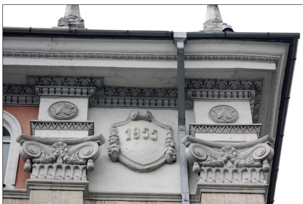
Figura 3. Scutul cu anul finalizării construcției, 1955, flancat de coloane decorative (foto L. Condraticova).

Arhitectura, dictată de autorități, impunea forme monumentale, care să reflecte natura clădirilor administrative ale epocii, în stilul grandomaniei sovietice. În rezolvarea compoziției fațadelor era necesar să se obțină expresivitatea maximă a imaginii unei clădiri publice (figura 4). „Atât arhitectura clădirii, cât și decorul ei sunt determinate de arhitectura monumentală sovietică din perioada stalinistă. ... Clasicismul monumental sovietic a devenit la acea vreme expresia armoniei și frumuseții în arhitectura unei țări care pretindea a fi un stat de tip nou al muncitorilor și țăranilor”, afirmă m. c. al AȘM Mariana Șlapac [14].