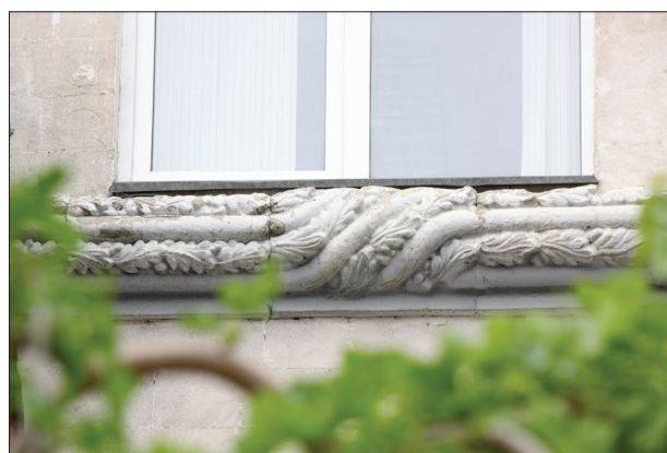
Figura 6. Brâul decorativ de pe fațada clădirii.

Pe lângă Sala Azurie, care este și sala principală, la etajul unu se află Sala Argintie și Sala Aurie, iar la etajul doi – Sala Mică. De asemenea, din patrimoniul AȘM fac parte trei tablouri celebre: Soarele și pâinea (1977, 130 × 170 cm.), Poarta Orheiului Vechi (1977; 130 × 140 cm.) și Săpăturile de la Orheiul Vechi (1977, 132 × 142 cm.), donații ale ilustrului artist plastic, membru de onoare al AȘM, Mihai Grecu (1916–1998). „Pentru Mihai Grecu, tripticul solicitat de Academie era mai