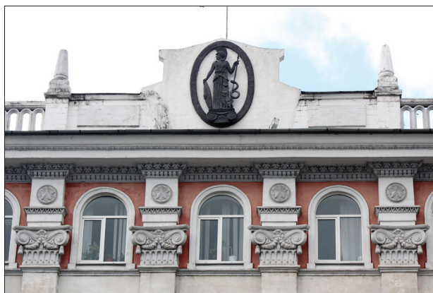
Figura 5. Frontispiciul cu emblema Academiei de Științe a Moldovei.

albă de calcar sunt individualizate prin pilaștri cu capiteli, cu elemente decorative caracteristice arhitecturii sovietice. Deasupra lor sunt plasate medalioane rotunde. Cel de-al cincilea nivel al clădirii cu ferestre arcuite a fost colorat în roșu. Construcția este încununată de un parapet perforat și un stâlp decorativ. O altă orizontală decorativă este brâul ornamentat (figura 6) între primul și cel de-al doilea nivel, inspirat din arhitectura medievală a mănăstirilor din spațiul românesc”, menționează m. c. Mariana Șlapac despre clădirea AȘM [14].