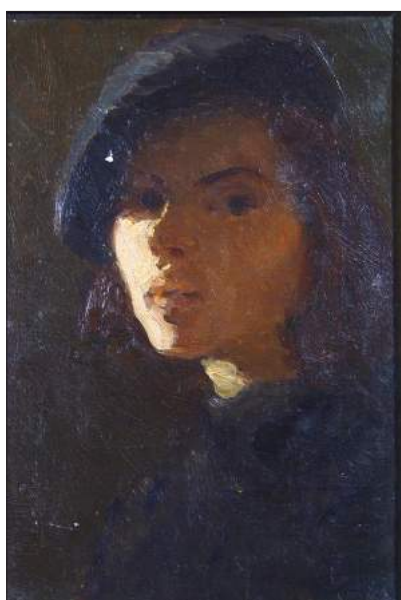
Ada Zevin. Autoportret în beretă neagră , 1959, ulei, carton, 35 × 25 cm

După plecarea sa în lumea celor drepte, MNAM a organizat, în 2008, 2013, 2018, expoziții in memoriam Ada Zevin, or o parte din lucrările sale se păstrează în colecția muzeului, dar și în numeroase colecții private din Republica Moldova, Ucraina, Polonia, Federația Rusă, Bulgaria, România, Suedia, Canada, SUA, Australia, Israel, Danemarca, Olanda. De menționat că, fiind acuzată de „indiferență socială” în perioada stărnării, Ada Zevin a fost recunoscută oficial abia la vârsta de 80 de ani [3, p. 4]. În 1998, pentru înalta măiestrie artistică, contribuție deosebită la dezvoltarea culturii artistice din Republica Moldova și pentru participare activă la formarea generațiilor de tineri plasticieni, Ada Zevin a fost decorată cu cea mai înaltă distincție de stat – „Ordinul Republicii”.