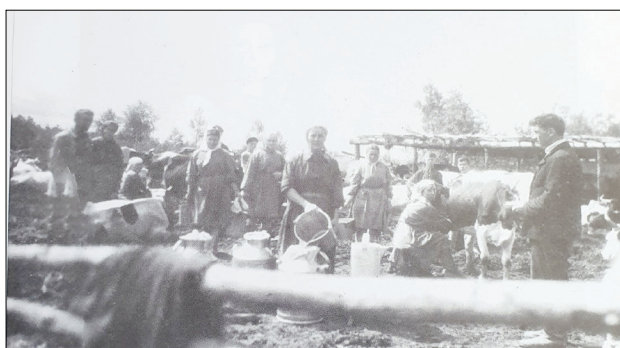
Figura 5. Basarabeni la o fermă din regiunea Tomsk, Siberia. [5, pp. 149-150].

„Ca să supraviețuiești trebuia să lucrezi, era o întreprindere de construcție a liniei ferate și ne-au mobilizat și lucram la ea. Se organiza un grup de lucru care trebuia să aranjeze linia telefonică de 25 de kilometri. Am lucrat și opt ani în pădure. Mai întâi am lucrat la linia ferată, apoi hamal la transportat lemne, dar mai mult am lucrat în pădure” [7, p. 133]. În afară de obligațiunile pe care le aveau lucrătorii de la căile ferate, cei deportați trebuiau să plătească mită din banii pe care îi primeau pentru munca prestată.