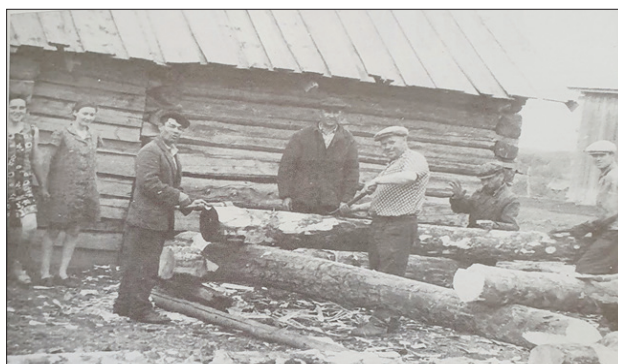
Figura 4. Basarabeni la prelucrarea lemnului, regiunea Tiumeni, 1957 [5, p. 359].

Tributul urma să fie plătit nu doar șefilor de sus, ci și brigadierilor.