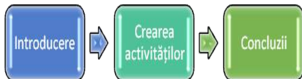
Figura 1. Etapele unui Subject Sampler.

La realizarea unui Subject Sampler se parcurg următoarele etape (figura 1):