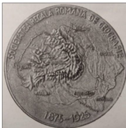
Figura 2. Emblema Societății Regale Române de Geografie. Sursa: [22, p. 29].