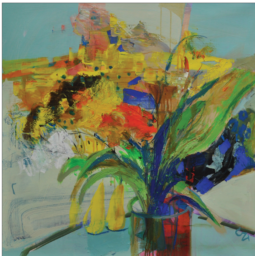
Victoria Cozmolici. Buchet cu pere , 2022, ulei, pânză, 90 × 90 cm.

74. Colesnic I. Chișinăul nostru necunoscut, ediția a III-a, revăzută, Chișinău: Cartier, 2020. 632 p.