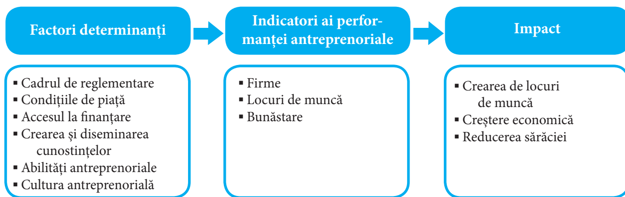
Figura 1. Structura sistemului de indicatori ai Programului Indicatorilor pentru Antreprenoriat